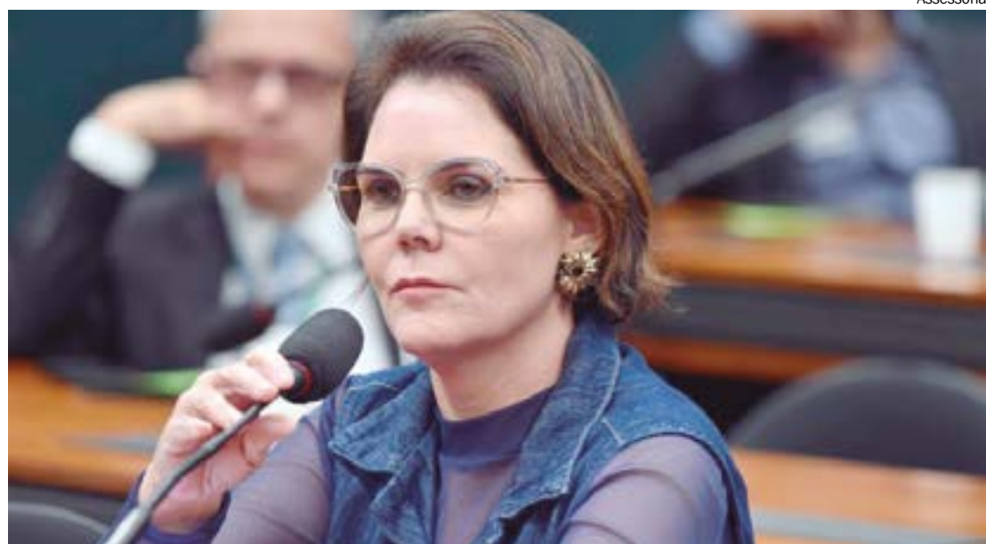
Segundo a deputada, Congresso precisa debater mais e construir uma proposta mais adequada à realidade do país

“Estamos ouvindo representantes da indústria, do agro, do comércio e agora também vamos ouvir a questão do trabalhador. Essa é a função do parlamentar”, completou.