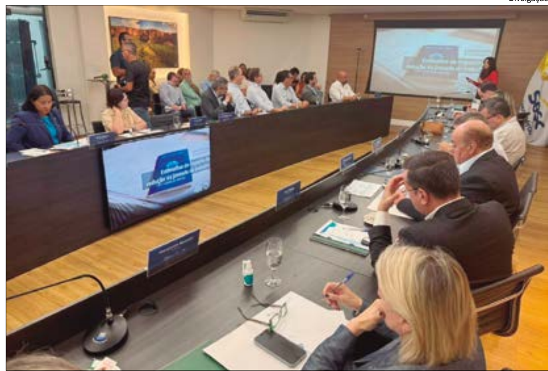
Congressistas receberam estudo técnico com dados sobre impactos da alteração da jornada de trabalho