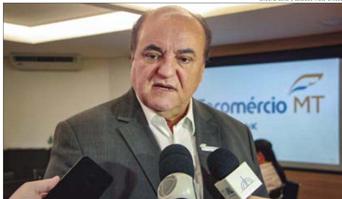
Segundo presidente da Fecomércio, fim da escala 6x1 “não vai ser benéfico” ao trabalhador