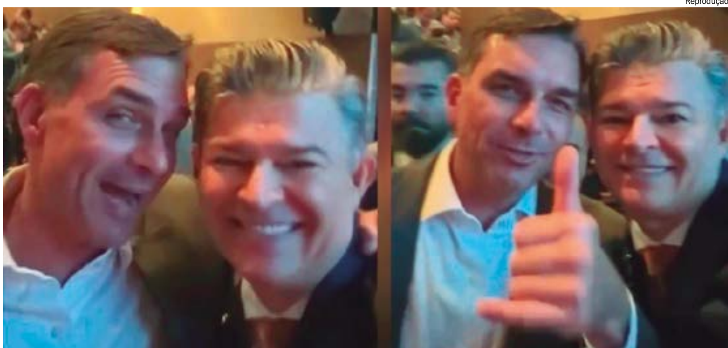
Pré-candidato à Presidência, Flávio Bolsonaro visita MT no dia 24 para lançar candidatura de Medeiros ao Senado

A presença de Flávio reforça o peso da articulação nacional na disputa local. Segundo Medeiros, o senador é um dos responsáveis por coordenar a formação de candidaturas alinhadas ao projeto político da direita em todo o país, em diálogo direto com o pai.