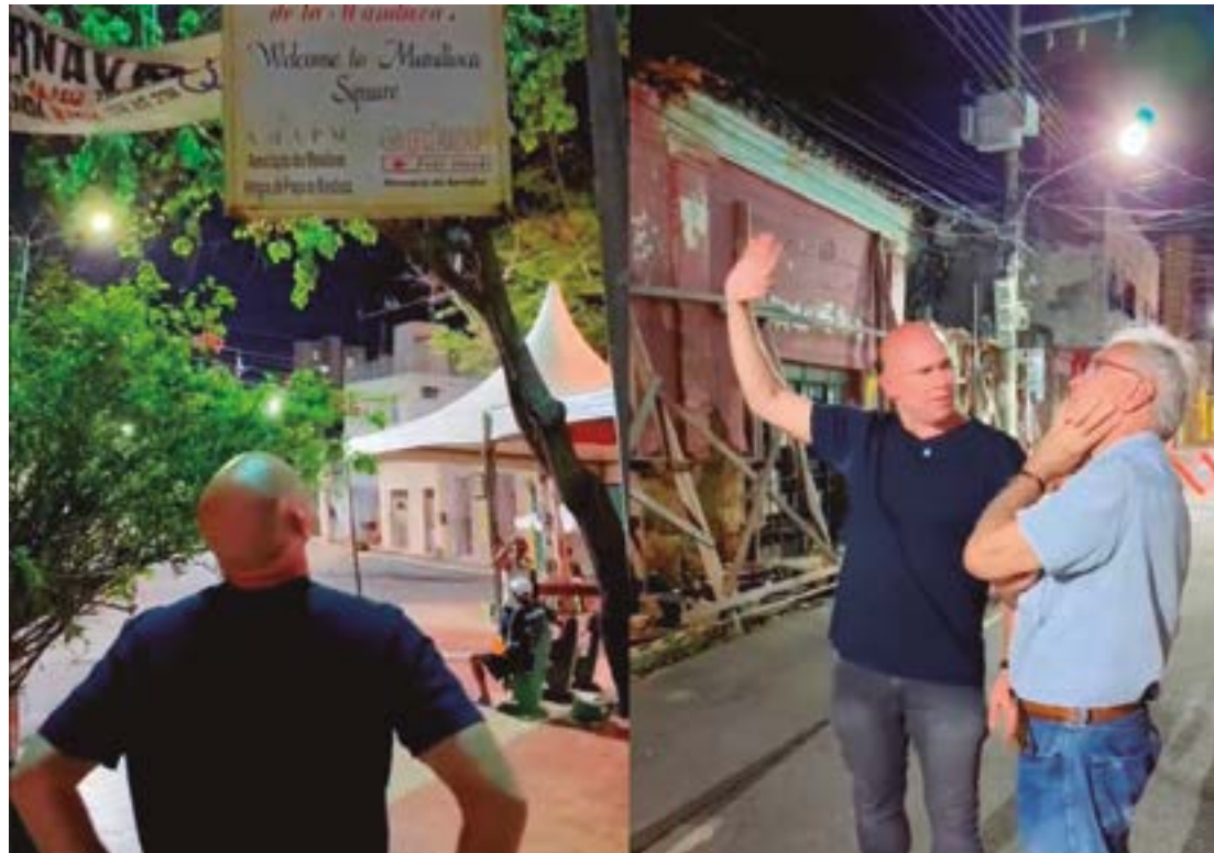
Calçadão na Praça da Mandioca faz parte de plano de revitalização e incentivo ao comércio local

Além da intervenção viária, o plano da gestão municipal inclui ações de revitalização e restauração de imóveis históricos no entorno da praça. Durante a visi-