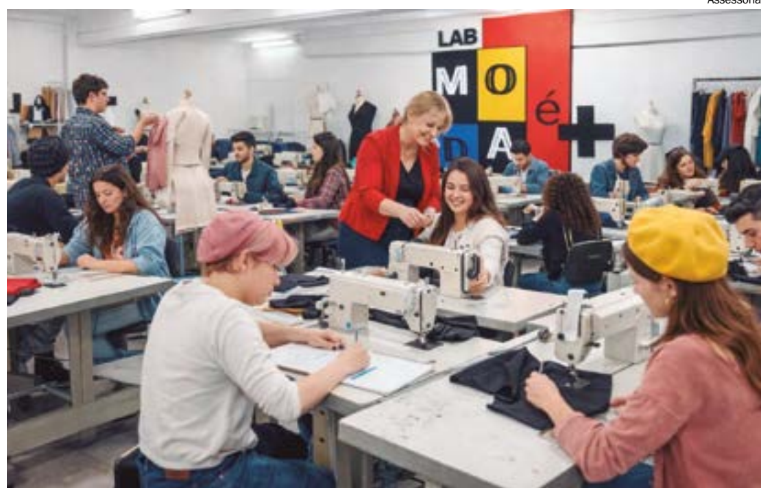
Com instrutores qualificados, laboratório vai oferecer uma formação ampla sobre moda